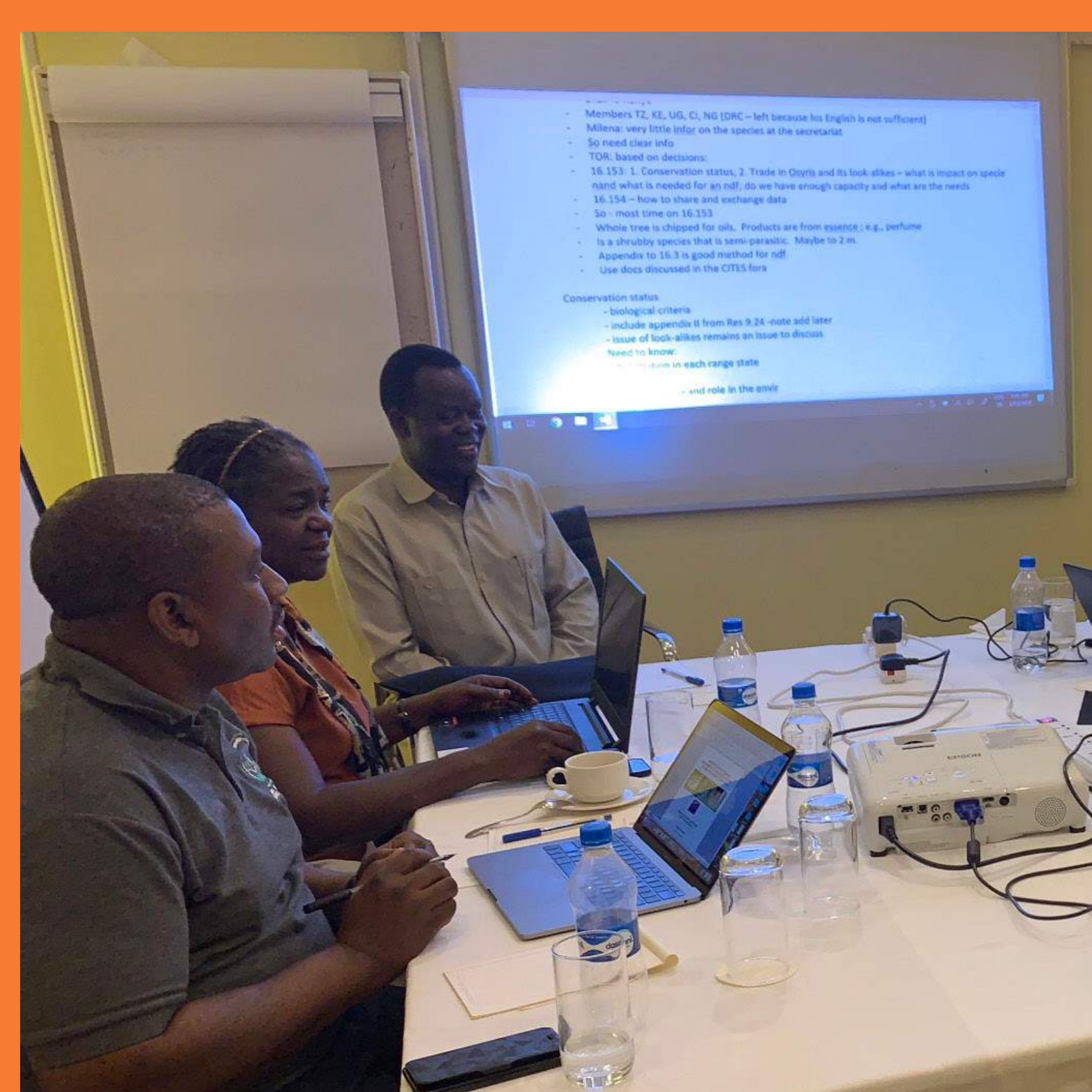
CITES Tree Species Programme Regional Meeting for Africa 11 to 15 March 2019 Dar es Salaam - Tanzania Groupe de travail sur Osyris lanceolata

Le 14 juillet 2017, Le Secrétariat de la Convention sur le commerce international des espèces de faune et de flore sauvages menacées d'extinction (CITES) et la Commission Européenne ont annoncé que l'Union européenne (UE) avait accordé une contribution financière substantielle à hauteur de 8 millions d'Euros en soutien du projet intitulé : Soutien à la gestion durable des espèces d'arbres en danger et à la conservation de l'éléphant d'Afrique . Le Programme sur les espèces d'arbres CITES soutiens les pays qui exportent des parties et des dérivés d'espèces d'arbres inscrites à la CITES qui ont une valeur commerciale. Les pays reçoivent de l'aide financière et pour la création ou le renforcement des capacités pour appliquer des mesures de conservation et de gestion visant à s'assurer que le commerce du bois, de l'écorce, des huiles et d'autres produits issus des espèces d'arbres inscrites à la CITES est durable, légal et traçable. Le programme vise à améliorer et renforcer la gouvernance des forêts et les capacités de lutte contre la fraude pour assurer des avantages à long terme, à contribuer au développement rural dans des zones souvent reculées, à la croissance économique durable au niveau national, et à l'allègement, à long terme, de la pauvreté.