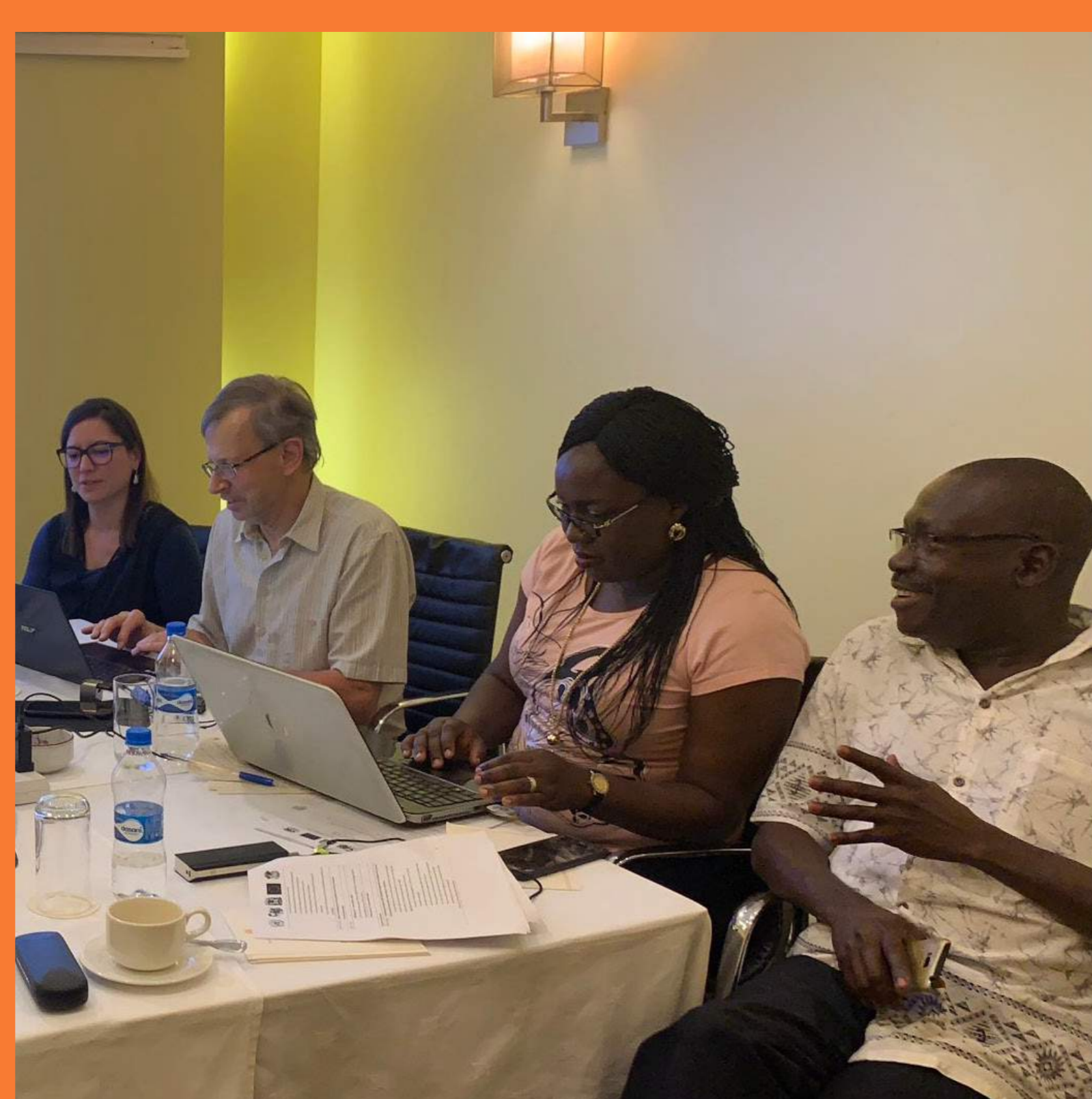
Groupe de travail sur Prunus africana