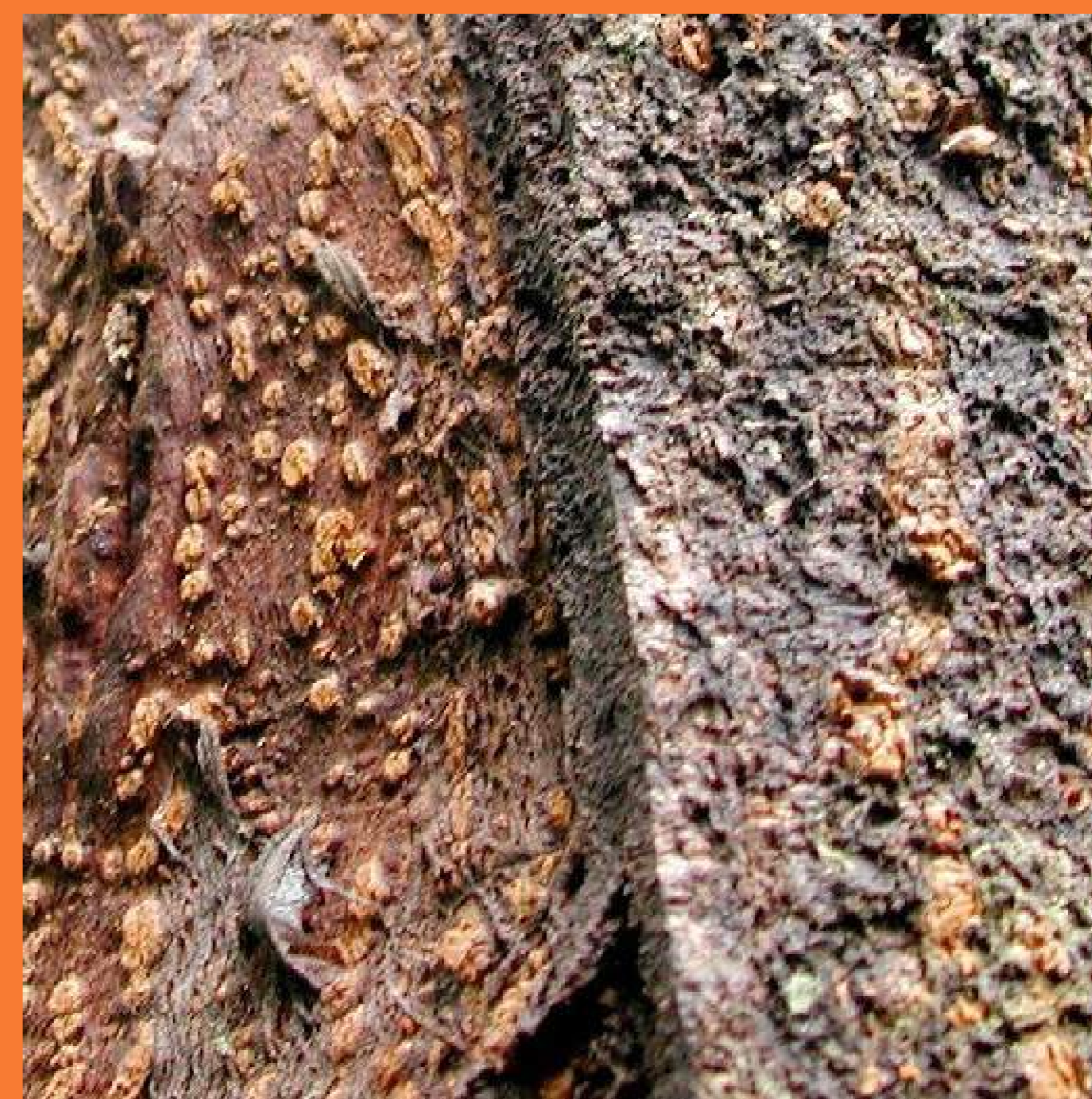
Prunus Africana