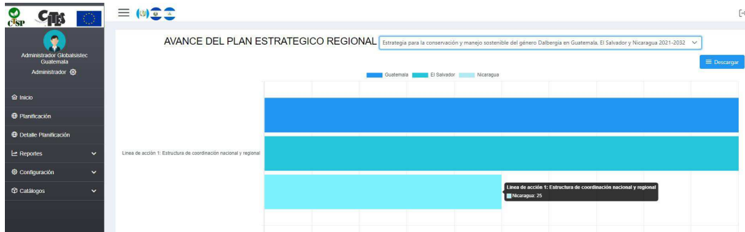
Gráfica de avances por línea de acción y país.

Este módulo, conocido dentro del sistema como reportes, nos permite conocer el avance de la ejecución del Plan Estratégico Regional, por línea de acción y actividad. La visualización es mediante grafica de barras que miden la ejecución en porcentaje.