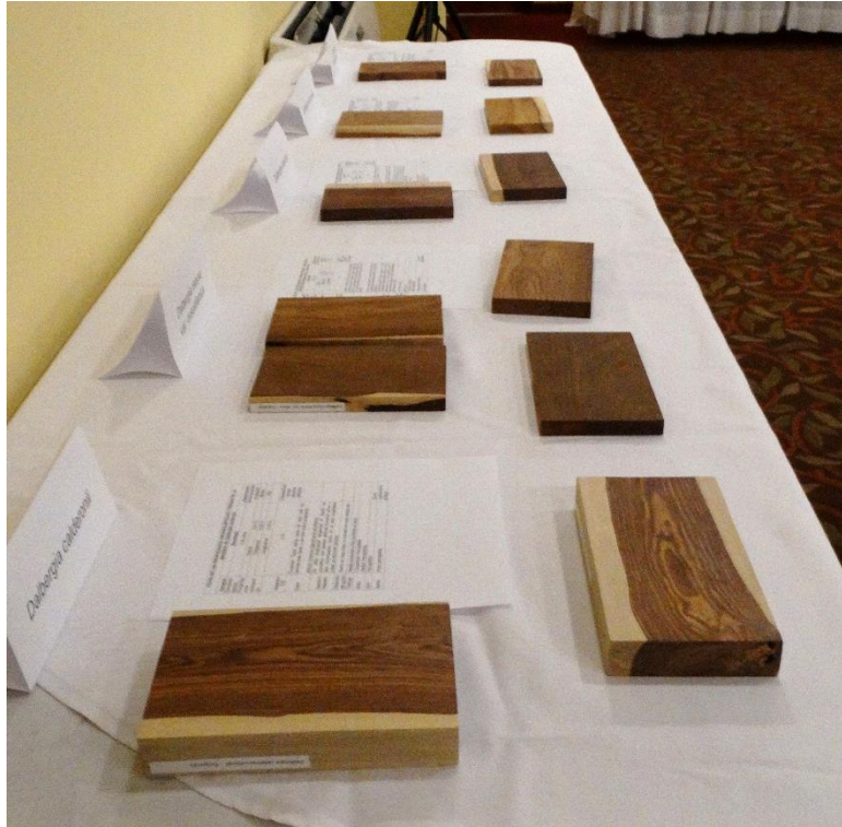
Fotografía 13. Exposición de las tablillas correspondientes a la madera de 5 especies de Dalbergia .