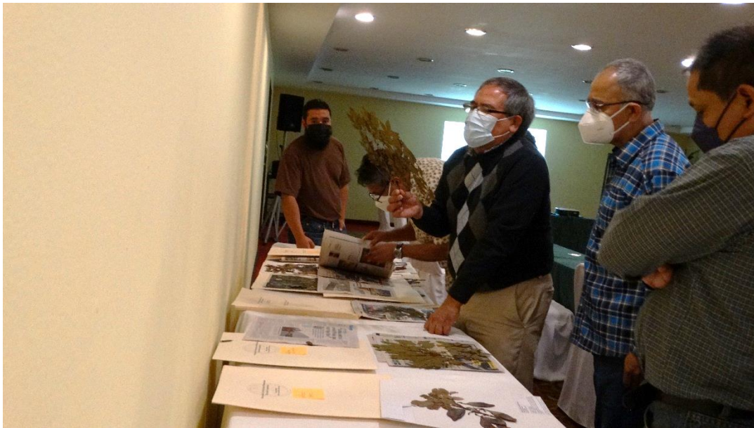
Fotografía 12. Revisión de las muestras botánicas de las especies del Género Dalbergia , por todos los expertos.