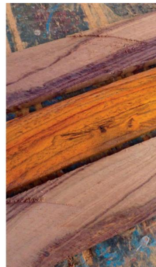
Fotografía 2. Parte del contenido de la ponencia del Ing. Agr. M. Sc. José Linares

Árboles, arbustos o bejucos. Hojas imparipinnadas; folíolos 1-muchos, alternos; estípulas ausentes; estípulas persistentes o caducas. Inflorescencias en racimos, panículas o cimas, terminales, axilares o laterales; brácteas subpersistentes; bractéolas pequeñas, apareadas en la base del cáliz, a menudo caducas; cáliz campanulado, lobos 5, subiguales o desiguales, el carinal más largo que los demás; pétalos glabros, blancos a amarillo-anaranjados; estambres 10, monadelfos, diadelfos o triadelfos o el estambre vexilar ausente, las anteras pequeñas, dídimas, basifijas, con dehiscencia apical. Frutos elípticos, oblongos, orbiculares, falcado-reniformes o lunulares, generalmente comprimidos, indehiscentes. Semillas 1-4(-6), reniformes, cafés.