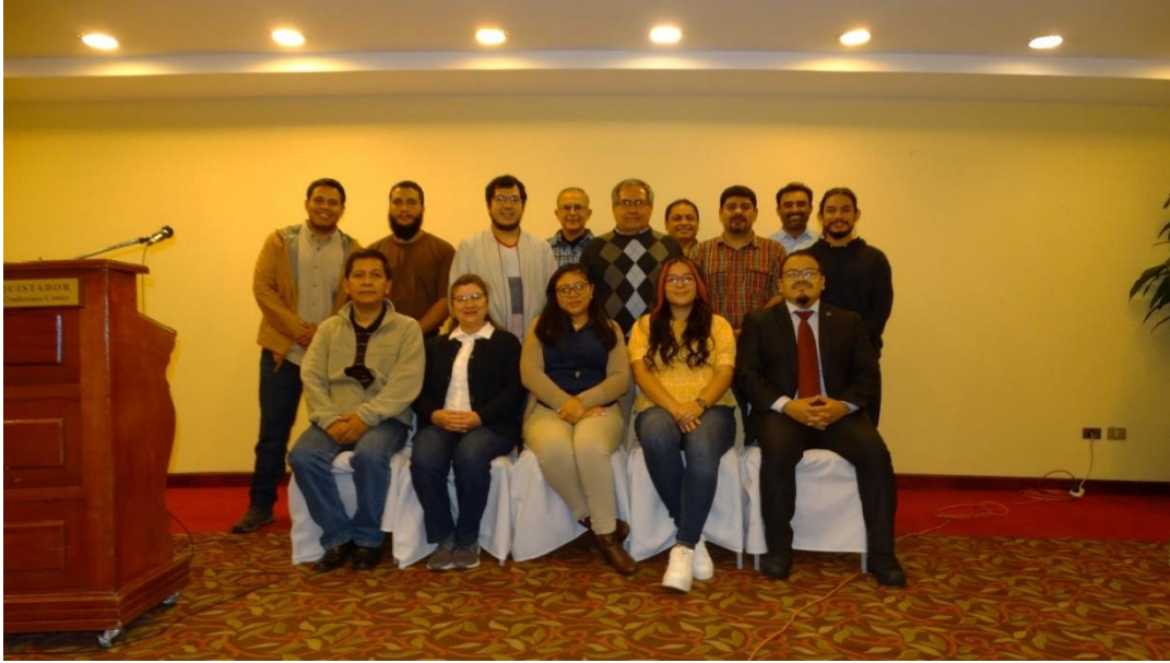
Fotografía 17. Expertos en los temas botánicos y moleculares, que participaron el taller.